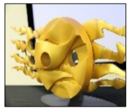
「地底の太陽」 作製のための模型

最近、皆さん、スマートフォンやタブレット使っておられますよね。写真もたくさん撮っているのでは? 私も、お花や景色、お料理などなど、なんでも手軽にパシャ! Lineの写真や動画も保存。写真がどんどん増えていきます。スマホのこんな絵のアプリ使っていますか? そうです! 『Google フォト』! もう使っていますよね! スマホで撮った写真をどんどんクラウドにバックアップしてくれて、タブレットやパソコンなど、どこからでも見られるし、お友達や家族にも簡単に共有して、見て欲しい写真だけを見てもらえます。他の人が、ダウンロードするのも簡単です。昔みたいに、写真を焼き増しして渡すことはなくなってしまいましたね。