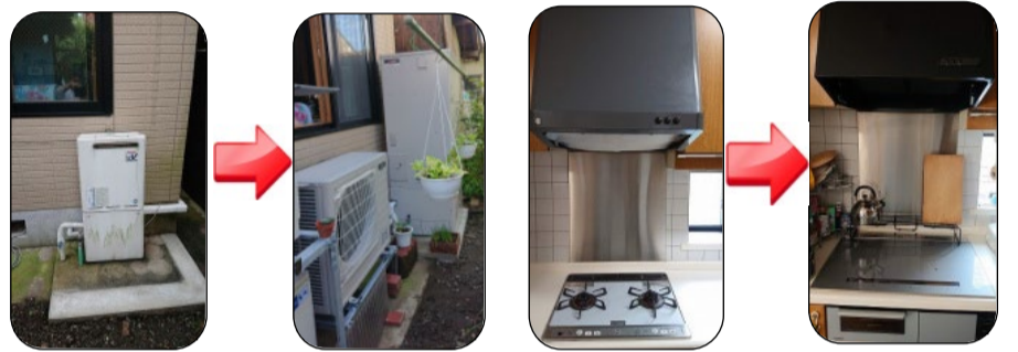
プロパンでの給湯からエコキュートに交換です。ガスコンロからIHに。換気扇も新しくなりました。

今までは、ガスコンロをお使いでしたが、IHコンロの火力もきっと満足していただけたと思います。