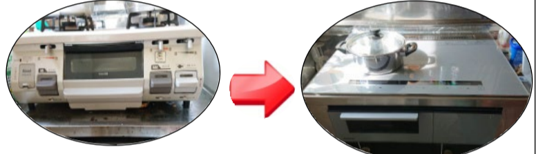
据え置きタイプのガステーブルからの交換です。設置枠を付けると、ビルトインIHも使えます。