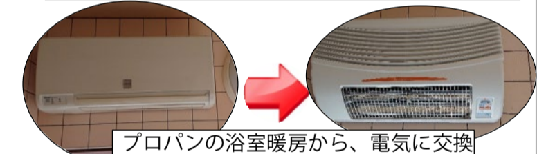
プロパンの浴室暖房から、電気に交換しました。