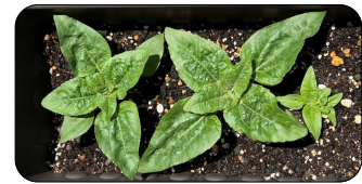
今、こんなに大きくなりました。毎日の水やりが楽しみです。

ウクライナの女性が、機関銃を持つロシア兵に向かって、「あなたがこの地で戦死する時、そのあとにひまわりが咲くようにポケットにひまわりの種を入れておきなさい」と種を差し出す映像が報道されました。今では、美しいひまわりが、抵抗の象徴となっています。